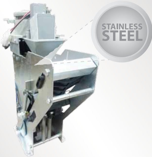
Steel Espresso Unit

Espresso, American café, American cafe with milk, café latte, cappuccino, cappuccino hazelnut, Mocha/Moka, Hot chocolate, Chocolate with milk, Remauccino, Hot water for tea.